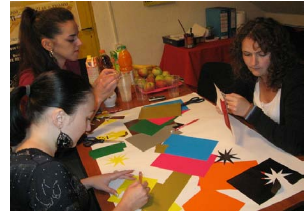
„KOŠNICA“ – VII radionica