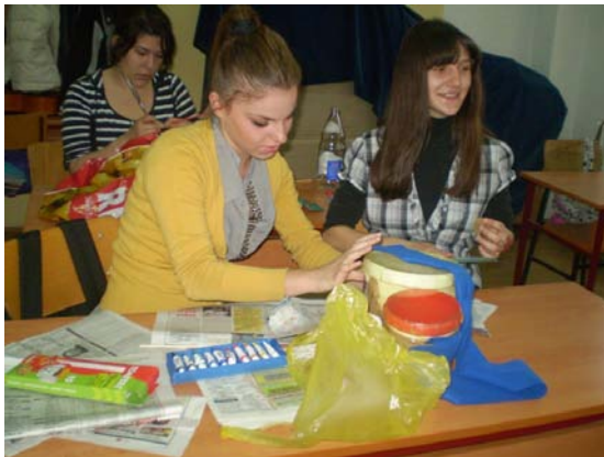
„Šansa za vašu budućnost“, III radionica