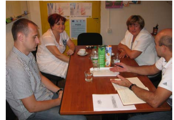
Radna posjeta pomoćnice ministra Trgovine i turizma