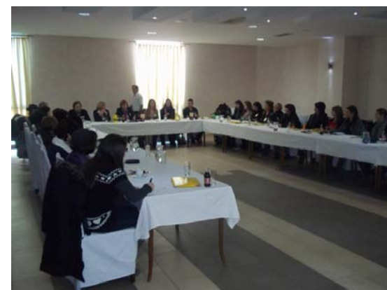
Okrugli sto na temu „Ljudska prava“