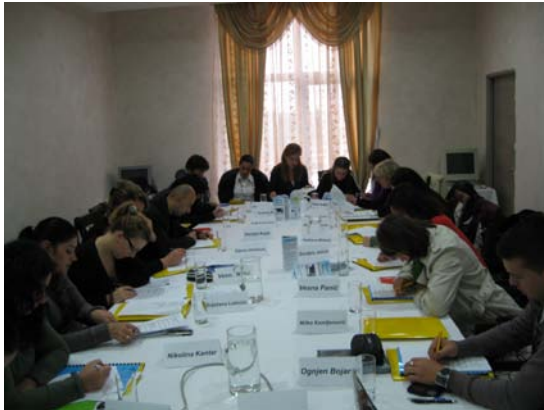
Animator i organizator događaja