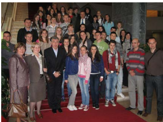
Posjeta Parlamentu BiH, učenici SŠ Prijedor