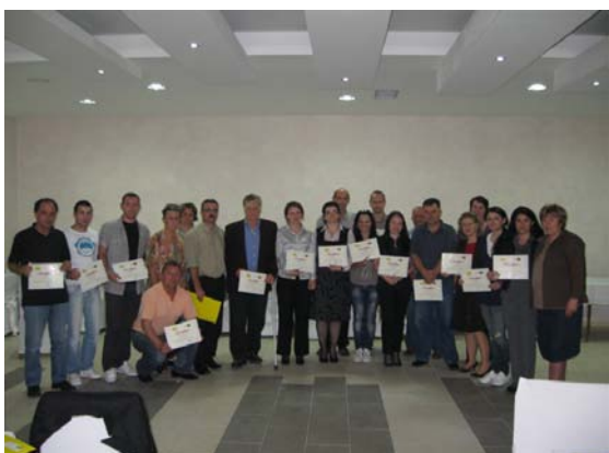
Trening „Javno zagovaranje“, RRC DON