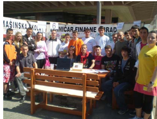
Festival „Da li si kreativan“