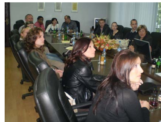
Prezentacija postignuća Fondaciji Mittal