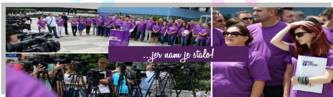
Godišnji izvještaj 2017. godine Udruženja građana "Demokratija-Organizovanje-Napredak"

Edukovano je ukupno 371 učenik trećih i četvrtih razreda srednjih škola iz Prijedora (Muzička Škola „Savo Balaban“ i srednja Elektrotehnička škola), te iz Novog Grada (JU SŠC „Đuro Radmanović“).